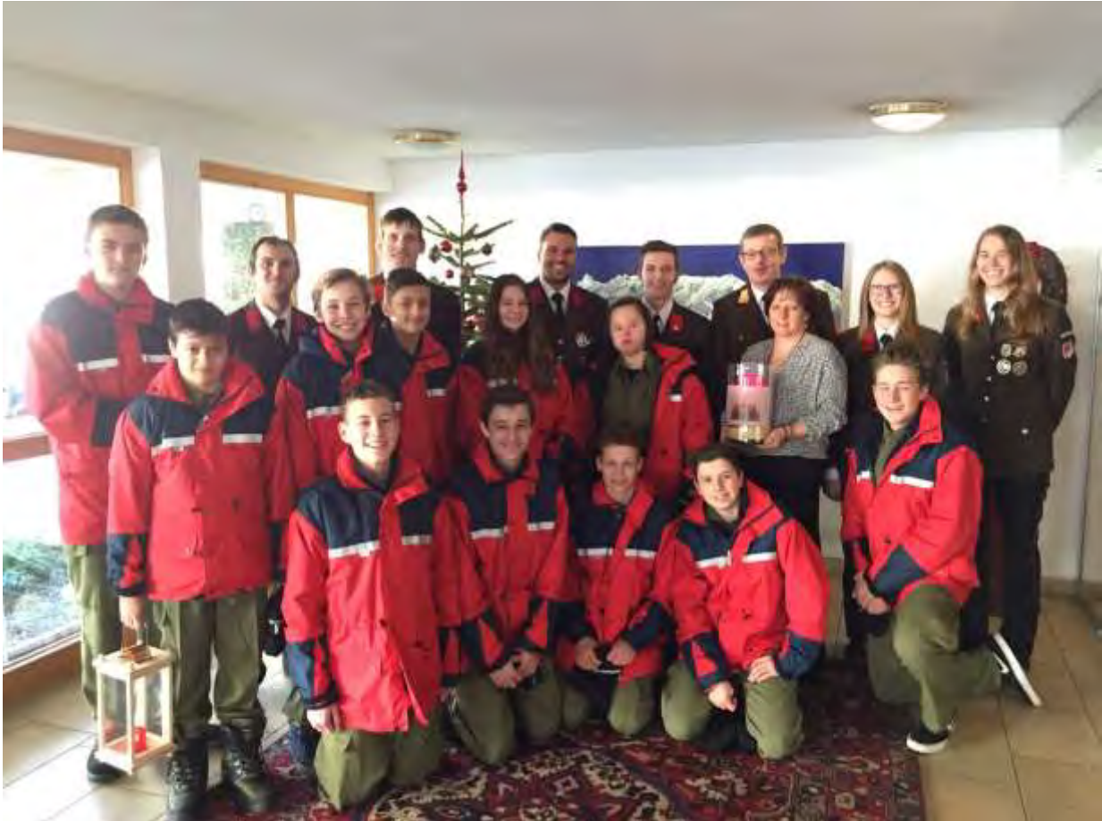
Mannschaftsfoto vom 24.12.2017